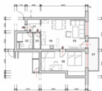
BYT E 1-1, rozšírené podlažia 3x BYTOVÝ DOM